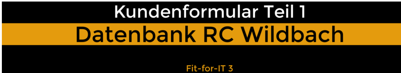
Abb. 03: Startbild des Videotutorials Kundenformular Teil 1

Wie man mithilfe eines Assistenten ein einfaches Formular zur Bearbeitung der Kundendaten für den RC Wildbach erstellt, kannst du mit Hilfe dieses Videotutorials nachvollziehen: