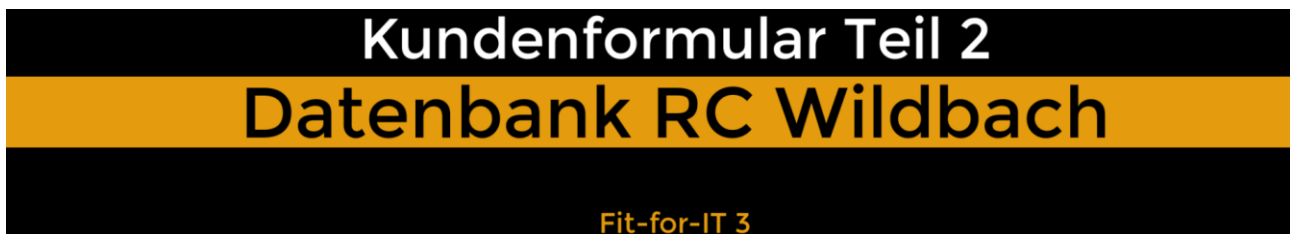
Abb. 04: Startbild des Videotutorials Kundenformular Teil 2

Im zweiten Teil des Videotutorials wird gezeigt, wie man verschiedene Steuerelemente einfügt, die die Bedienbarkeit des Formulars verbessern: