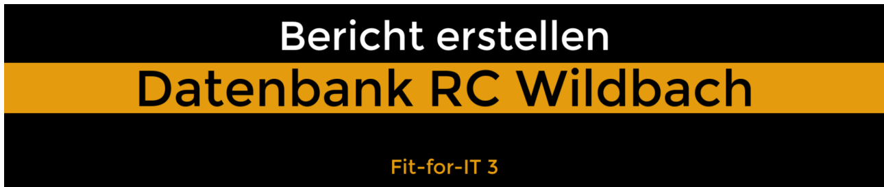
Abb. 03: Startbild des Videotutoriums Bericht erstellen

Wie man einen einfachen Bericht erstellt, kannst du mit Hilfe dieses Lernvideos nachvollziehen: