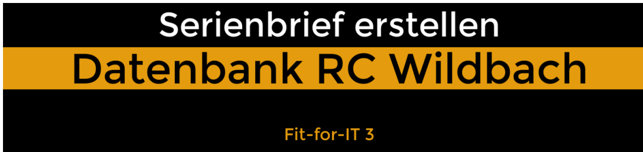
Abb. 03: Startbild des Videotutorials Serienbrief erstellen

Die Erstellung unseres Serienbriefes kannst du mit Hilfe dieses Lernvideos nachvollziehen: