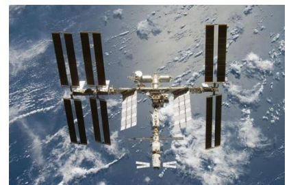
Die ISS im Juni 2008

Am Städtischen Gymnasium Herzogenrath (Amateurfunkrufzeichen DR0G) fand im Rahmen des Projekts ARISS ein Funkgespräch mit der Internationalen Raumstation ISS statt. In dem Audiomitschnitt* des Schulkontaktes mit dem Astronauten Mike Finke auf der ISS (OR4ISS) am 7.2.2009 sind die Fragen der Schüler und die Antworten von der ISS aufgezeichnet. ( .\251-materialien\funk\ariss-school-contact-e.mp3 ) Zu Beginn der Aufzeichnung war die ISS kaum zu verstehen, nach kurzer Zeit war das Verbindungsproblem aber gelöst und die Antworten sind gut verständlich. Besonders klar verständlich ist auch das „over“ am Ende jeder Nachricht.